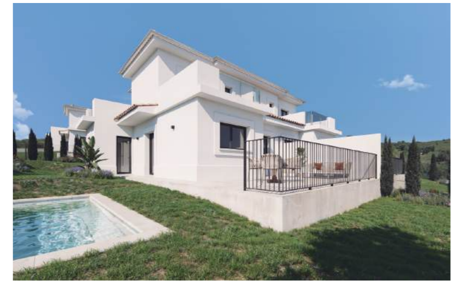
Property type F. Subject to land characteristics. May include upgrades not included in the basic price. / Wohnung Typ F. Abhängig von der Beschaffenheit des Geländes. Kann Upgrades enthalten, die nicht im Grundpreis enthalten sind.