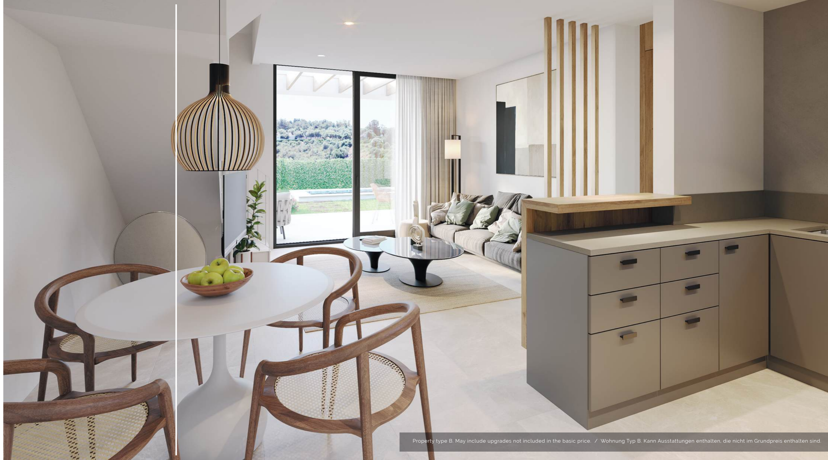
Property type B. May include upgrades not included in the basic price. / Wohnung Typ B. Kann Ausstattungen enthalten, die nicht im Grundpreis enthalten sind.

Die Warm- /Kaltinstallation sorgt für zusätzlichen Komfort und Wohlbefinden. Außerdem verfügen alle Villen über einen Außenparkplatz.