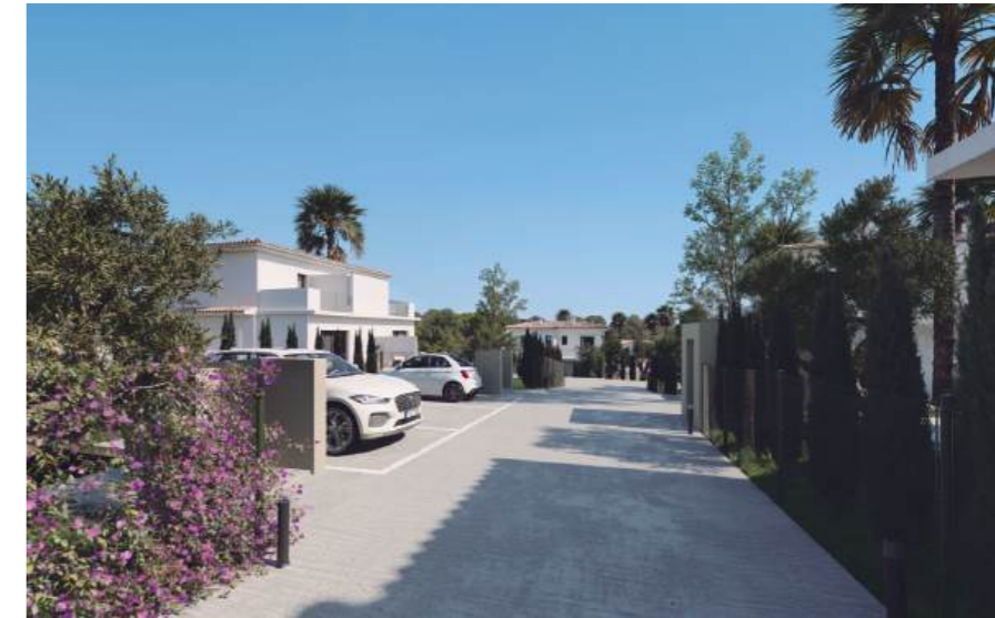
Advertising and non-contractual image. / Unverbindliches Werbebild.

A residential complex with everything you need Eine Wohnanlage mit allem, was man braucht