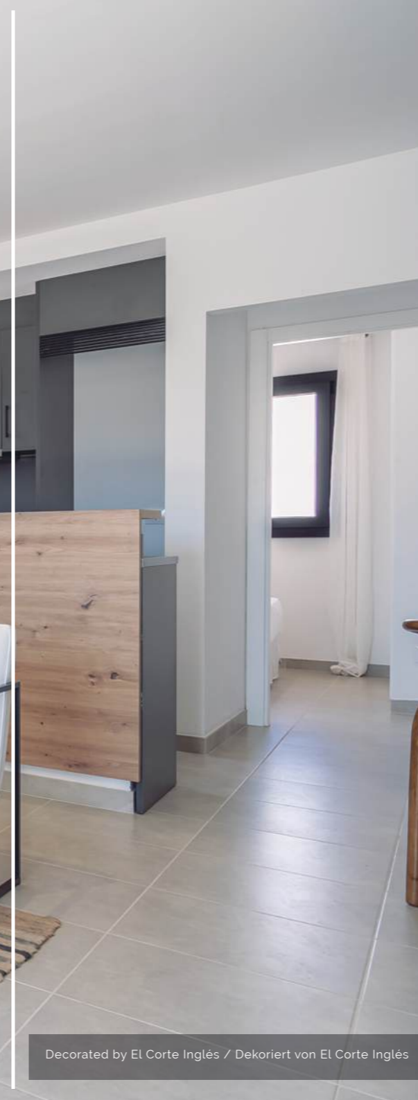
Decorated by El Corte Inglés / Dekoriert von El Corte Inglés