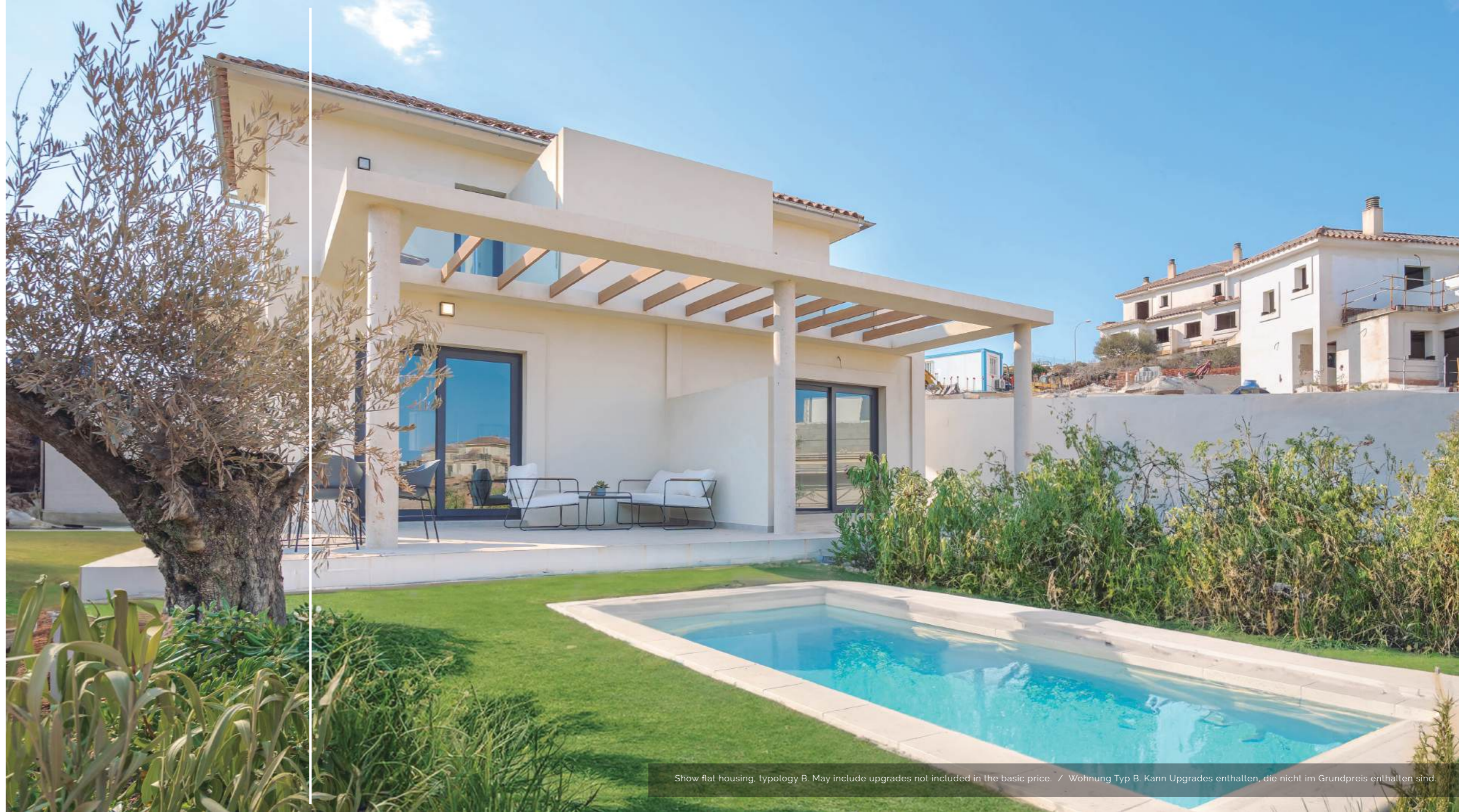
Show flat housing, typology B. May include upgrades not included in the basic price. / Wohnung Typ B. Kann Upgrades enthalten, die nicht im Grundpreis enthalten sind.