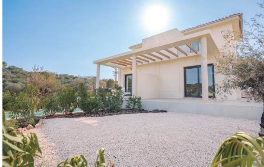
Show flat housing, typology B. May include upgrades not included in the basic price. / Wohnung Typ B. Kann Upgrades enthalten, die nicht im Grundpreis enthalten sind.