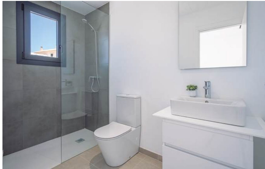
Show flat housing, typology B. May include upgrades not included in the basic price. / Wohnung Typ B. Kann Upgrades enthalten, die nicht im Grundpreis enthalten sind.