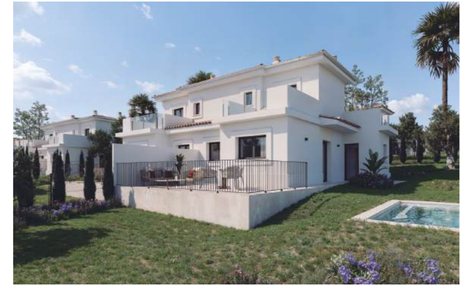
Property type F. Subject to land characteristics. May include upgrades not included in the basic price. / Wohnung Typ F. Abhängig von der Beschaffenheit des Geländes. Kann Upgrades enthalten, die nicht im Grundpreis enthalten sind.

Outdoor areas to enjoy Außenbereiche zum Genießen