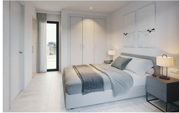
Property type B. May include upgrades not included in the basic price. / Wohnung Typ B. Kann Ausstattungen enthalten, die nicht im Grundpreis enthalten sind.