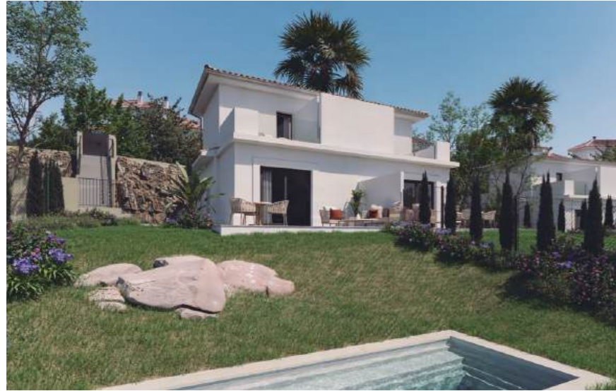
Property type E. Subject to land characteristics. May include upgrades not included in the basic price. / Wohnung Typ E. Abhängig von der Beschaffenheit des Geländes. Kann Upgrades enthalten, die nicht im Grundpreis enthalten sind.

These villas create a warm and functional home. Their true magic lies in the Mediterranean design and harmony with the outdoor space, providing enjoyment throughout the seasons.