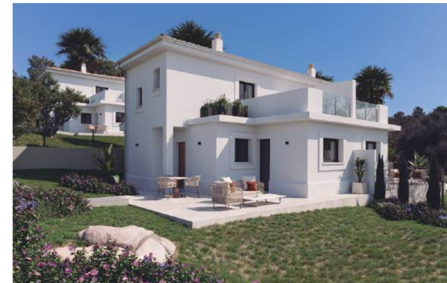
Property type D. Subject to land characteristics. May include upgrades not included in the basic price. / Wohnung Typ D. Abhängig von der Beschaffenheit des Geländes. Kann Upgrades enthalten, die nicht im Grundpreis enthalten sind.

Each villa is characterized by an undeveloped plot, a terrace, outdoor parking space, and the option to install a pergola to make the most of the idyllic surroundings and the unique climate of the island.