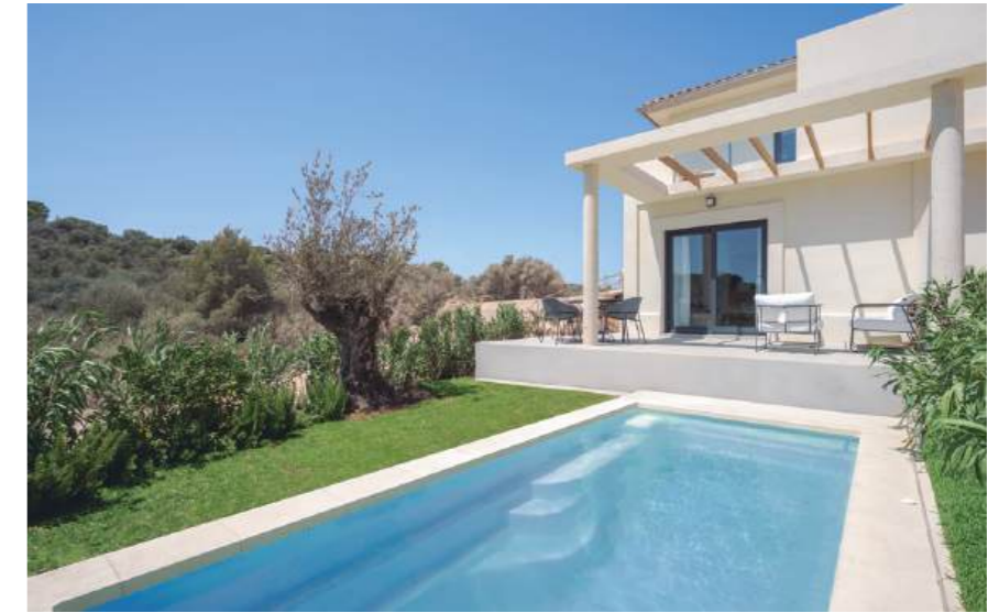
Show flat housing, typology B. May include upgrades not included in the basic price. / Wohnung Typ B. Kann Upgrades enthalten, die nicht im Grundpreis enthalten sind.