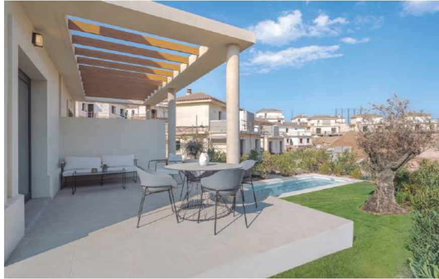
Show flat housing, typology B. May include upgrades not included in the basic price. / Wohnung Typ B. Kann Upgrades enthalten, die nicht im Grundpreis enthalten sind.