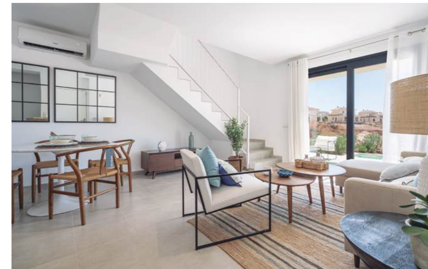
Show flat housing, typology B. May include upgrades not included in the basic price. / Wohnung Typ B. Kann Upgrades enthalten, die nicht im Grundpreis enthalten sind.