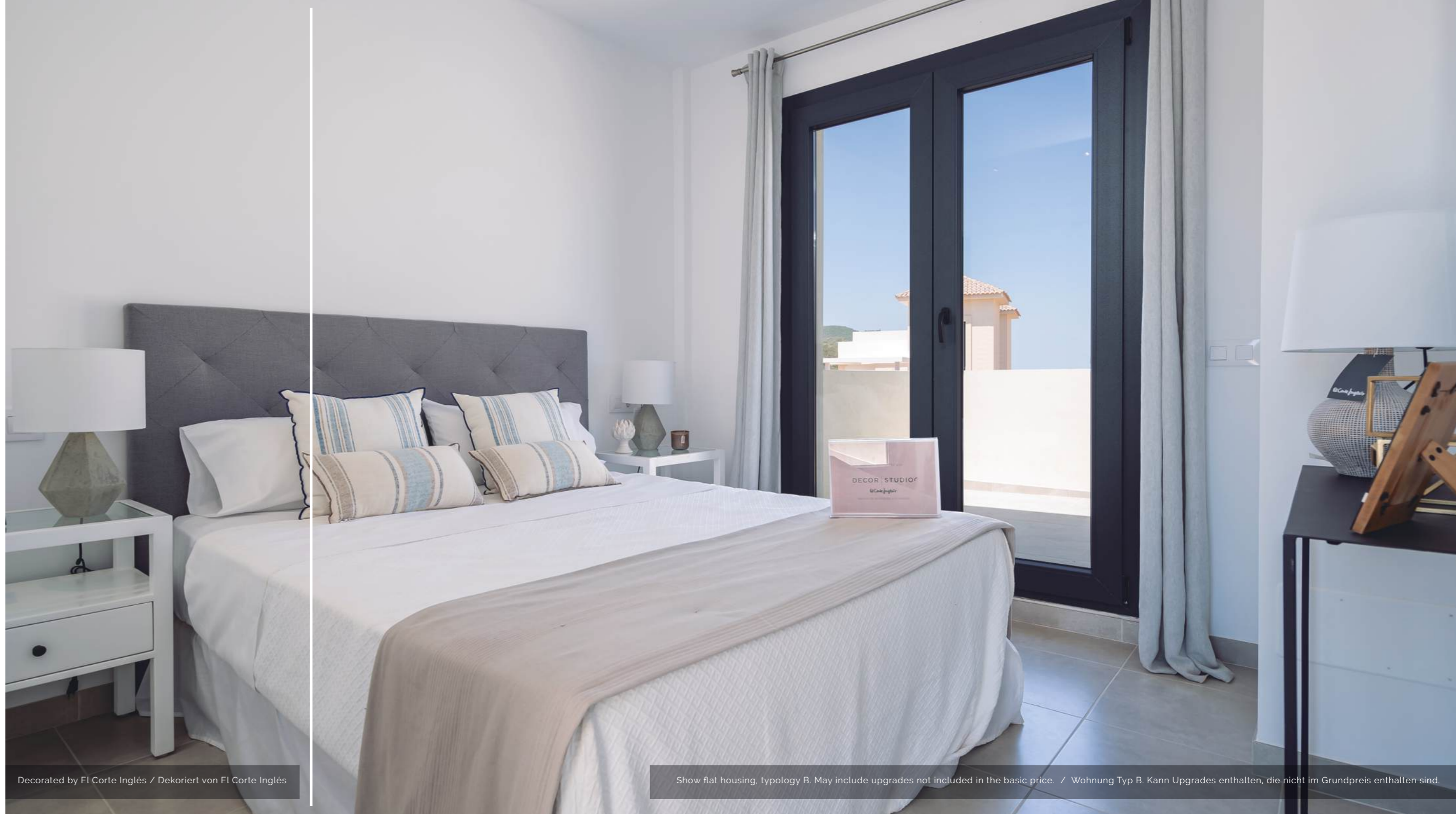
Decorated by El Corte Inglés / Dekoriert von El Corte Inglés