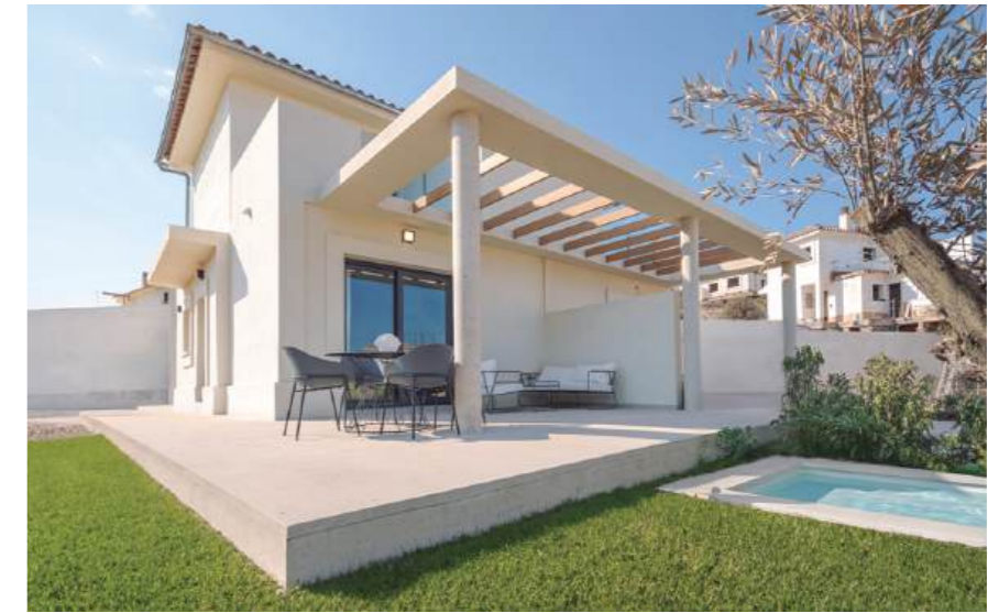
Show flat housing, typology B. May include upgrades not included in the basic price. / Wohnung Typ B. Kann Upgrades enthalten, die nicht im Grundpreis enthalten sind.

Discover our show villa Entdecken Sie unsere Mustervilla