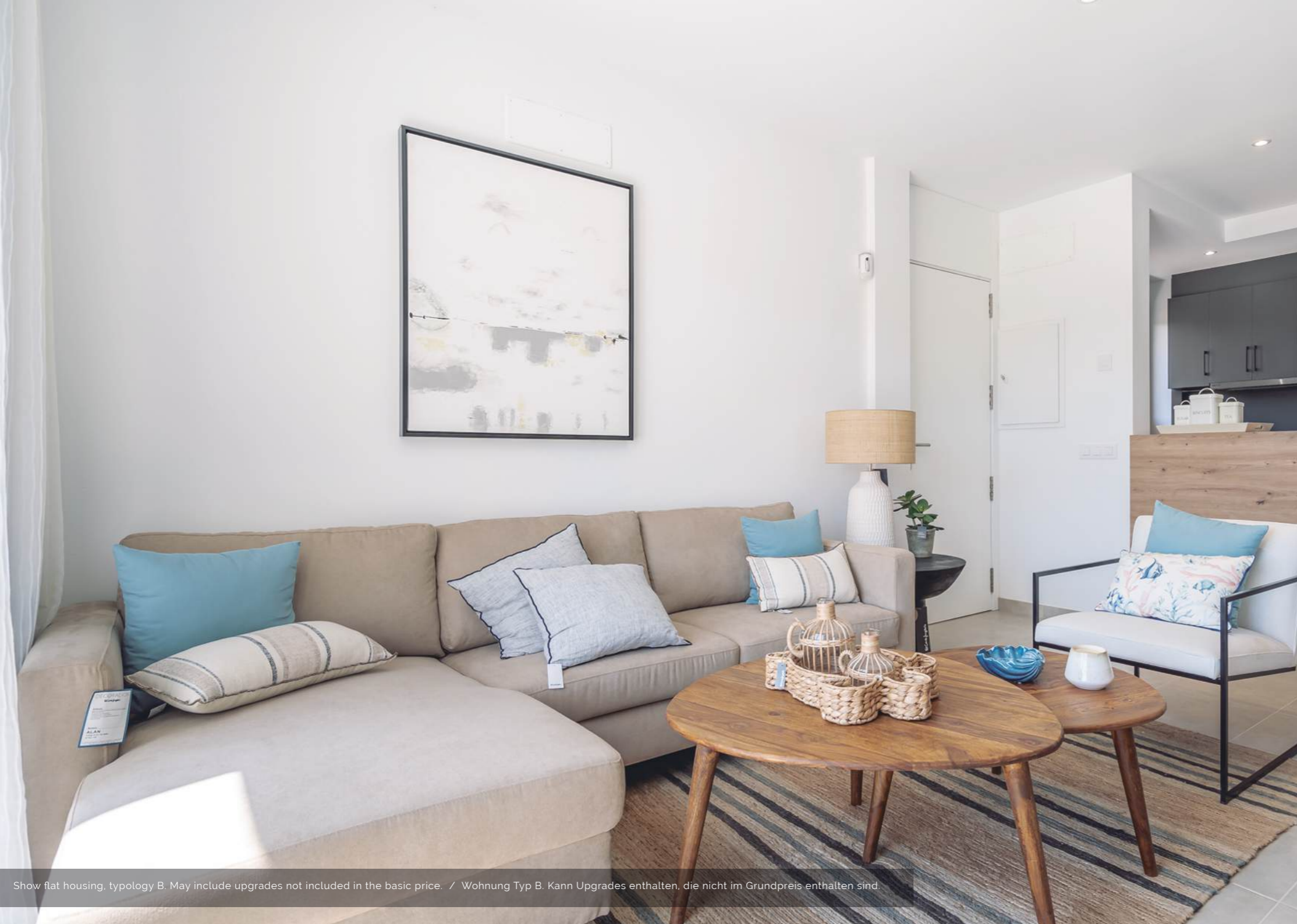
Show flat housing, typology B. May include upgrades not included in the basic price. / Wohnung Typ B. Kann Upgrades enthalten, die nicht im Grundpreis enthalten sind.