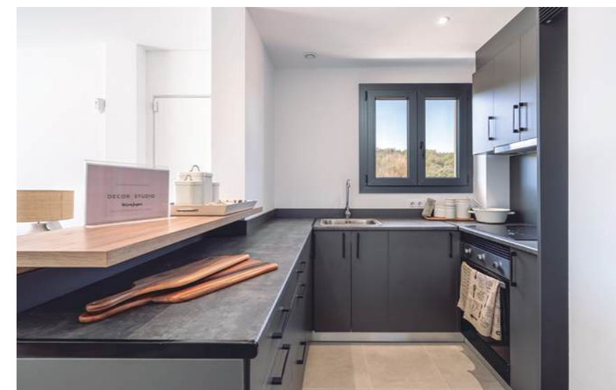
Show flat housing, typology B. May include upgrades not included in the basic price. / Wohnung Typ B. Kann Upgrades enthalten, die nicht im Grundpreis enthalten sind.