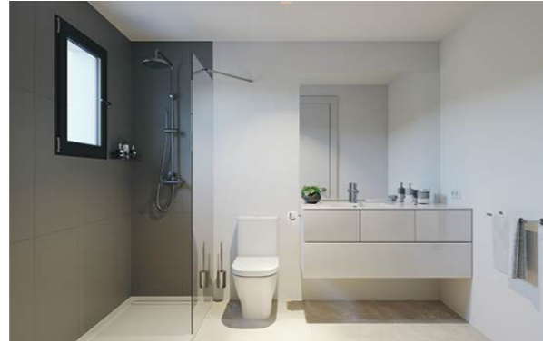
Property type B. May include upgrades not included in the basic price. / Wohnung Typ B. Kann Ausstattungen enthalten, die nicht im Grundpreis enthalten sind.

Villas equipped with everything necessary for comfortable living.