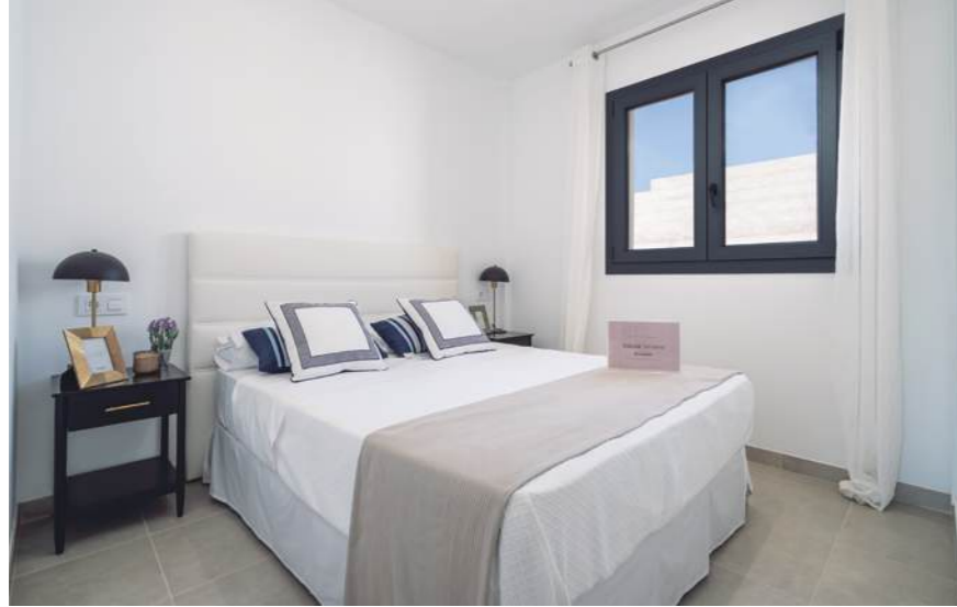
Show flat housing, typology B. May include upgrades not included in the basic price. / Wohnung Typ B. Kann Upgrades enthalten, die nicht im Grundpreis enthalten sind.